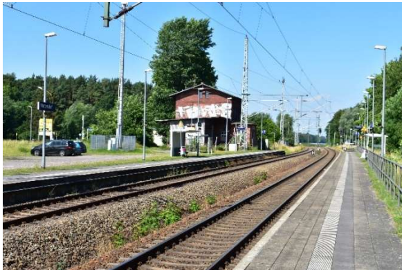
P&R-Anlage im Bereich des ehemaligen Ladegleises