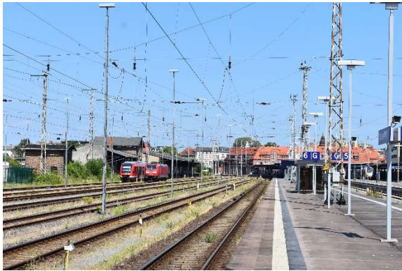
Recht üppige Durchgangsgleise in Stralsund