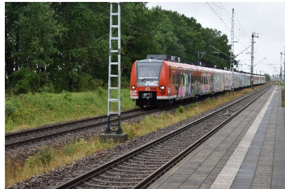
...und schon wieder eine BR 425 auf dem Weg nach Mukran (?). Wartet noch die Einfahrt des RE aus Stralsund ab.