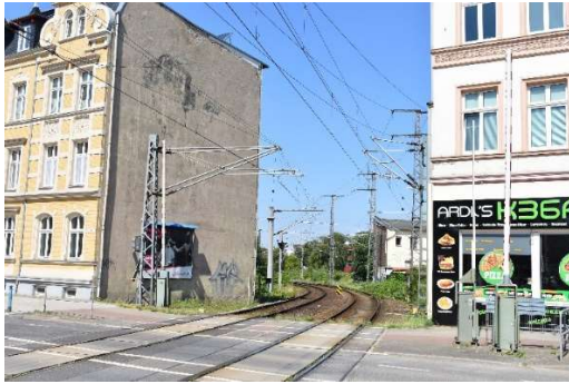
Bahnübergang km 0,3 am Tribseer Damm Ri. Rostock