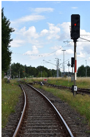
Ausfahrtsignal K Gl. 3 (betriebl. Gl. 8) im Bahnhof Rövershagen nach Graal-Müritz