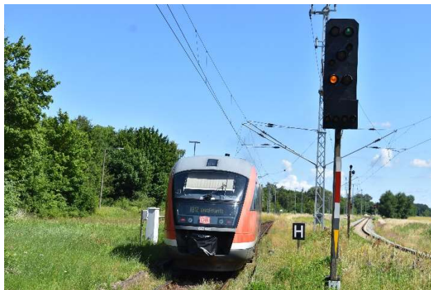
Weiterfahrt in die nicht elektrifizierte (und sehr sehr grüne) Strecke nach Graal-Müritz. Rechtes Gleis führt weiter nach Ribnitz-Damgarten.