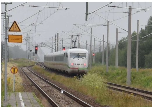
ICE Ri. Rövershagen mit außerplanmäßigem Halt, da der verspätete RE noch im Streckengleis ist