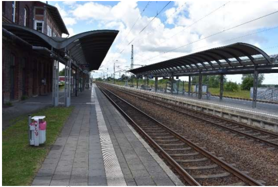
Velgast. Örtlich besetztes Thales-ESTW. Früher mit Eingabestift, jetzt wie üblich mit Maus bedient.