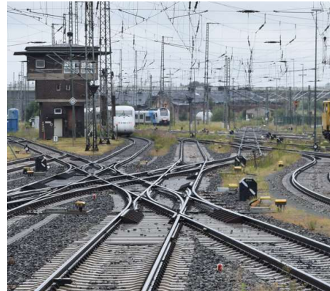
Doppelkreuzungsweichen im östlichen Bahnhofsbereich