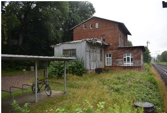
Buchenhorst – einsamer Bahnhof im Wald. Wohl vorwiegend für Bewohner von Löbnitz (ca. 5 km entfernt) gedacht. Ferngesteuert von Velgast.