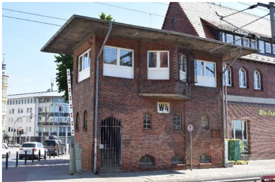
GS II DR-Stellwerk W4 an der Westseite des Stralsunder Bahnhofs