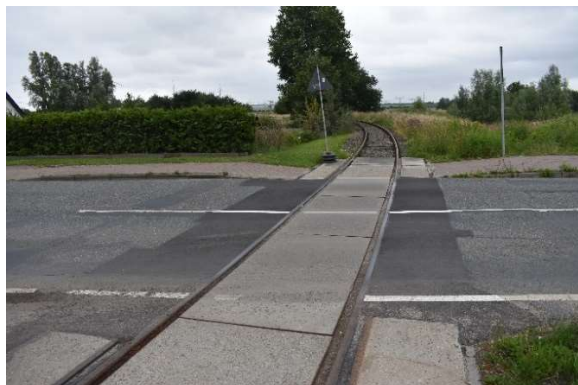
...Gleis Umspannwerk Ri. Westen