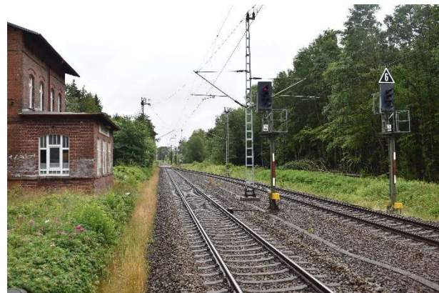
Ausfahrtsignale Buchenhorst Ri. Stralsund