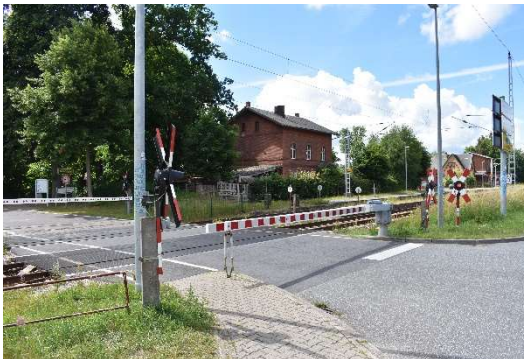
Bahnübergang Gelbensande an der Kreuzung B 105 nach Willershagen