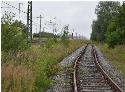
Gleis Umspannwerk Ri. Bahnhof Bentwisch