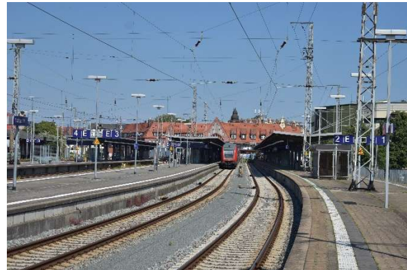
Stralsund Kopfgleise 1-3 und Durchgangsgleis 4