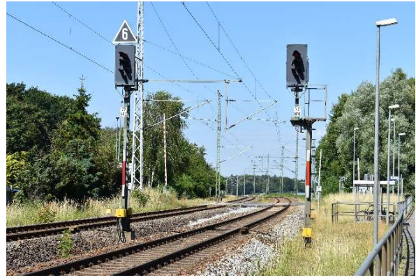
Ausfahrtsignale Ri. Rostock