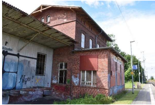
Empfangsgebäude Altenwillershagen, mit Bretterverschlagen verziert