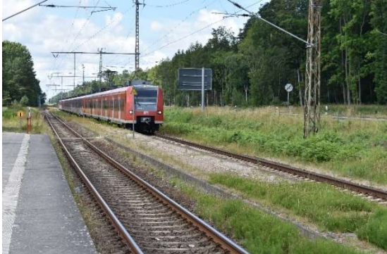
Gelbensande Gl. 2 mit BR 425, vermutlich zum DB Stillstandsmanagement nach Mukran