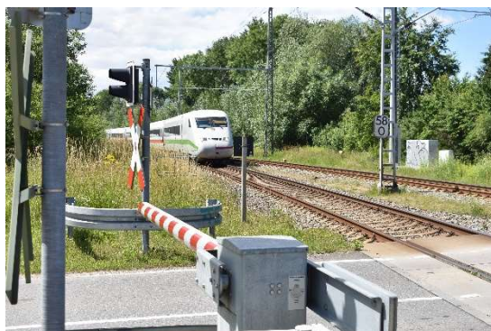
Bahnübergang km 058,005 auf westlicher Bahnhofsseite