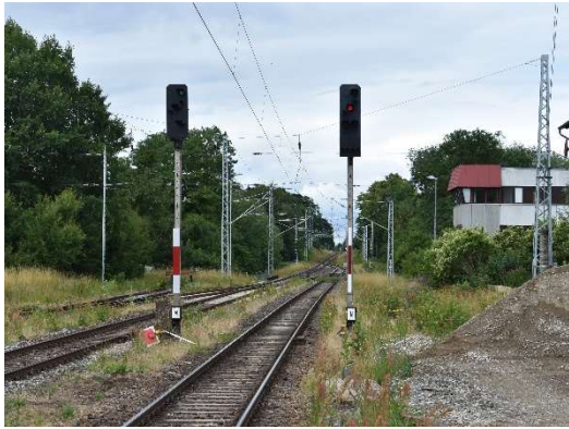
Ribnitz-Damgarten West mit den Ausfahrtsignalen M und N Ri. Rostock; rechts das örtlich besetzte GS II DR-Stellwerk