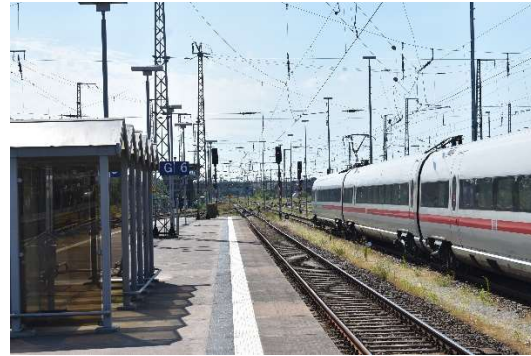
Leer-ICE bereit sich auf Ausfahrt nach Binz vor.