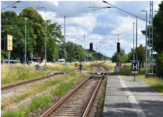
Gelbensande Ausfahrtsignal B und C Ri. Ribnitz-Damgarten