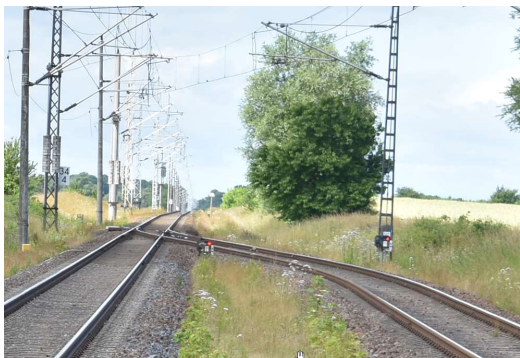
Detail Ausfahrt Altenwillershagen Ri. Rostock