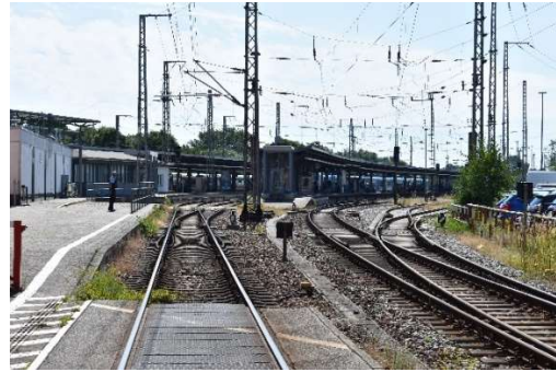
Bahnübergang km 0,3 Ri. Stralsund, rechts die Güterzug- und Abstellgleise