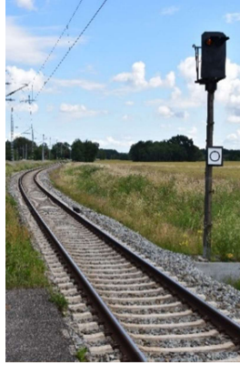
Rövershagen Gl. 2 Ri. Ribnitz-Damgarten mit Vorsignal zum Ausfahrtsignal C