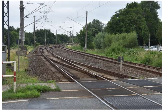
Bentwisch- linkes Gleis Ri. Rostock Hbf, rechtes Gl. Ri. Rostock-Seehafen