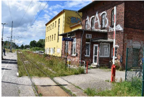
Höhengleicher Bahnsteigzugang zu Gl. 2