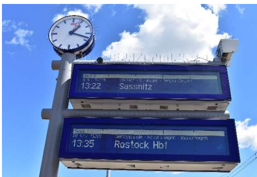
Anzeigetafeln Ribnitz-Damgarten West