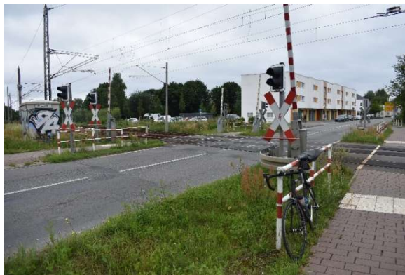
Bahnübergang an westlicher Bahnhofsseite