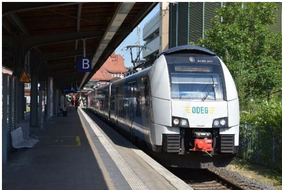
Stralsund Kopfgleis 1