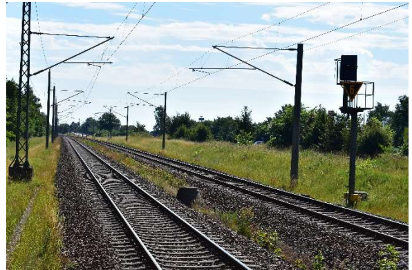
Bahnhof Martensdorf Ri. Stralsund mit Vorsignal