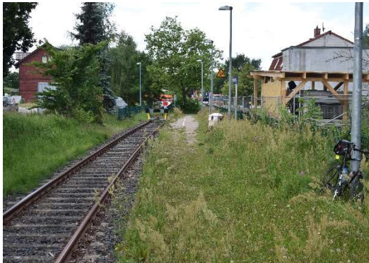
Rövershagen Gl. 3 (betriebl. Gl. 8). Hier starten und enden nur einige Mittagspendelzüge nach Graal-Müritz