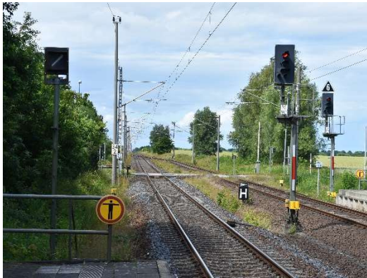
Ausfahrt Altenwillershagen Ri. Rostock