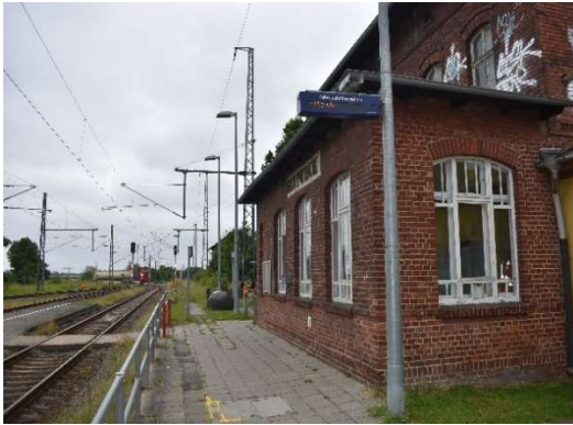
Stellwerk Bentwisch – örtlich besetzt. Mischung aus mechanischem Stellwerk und Gleisbildstellwerk (GS II DR). Vom Fdl gesicherter höhengleicher Bahnsteig zu Gl. 2