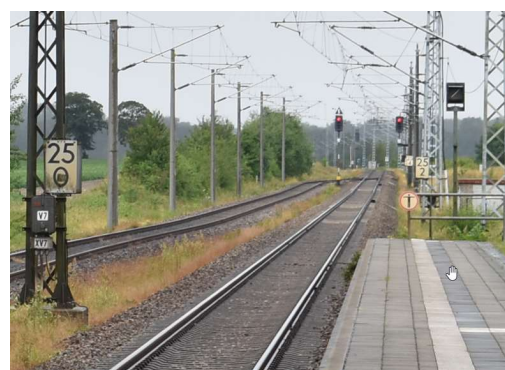
Ausfahrtsignale Buchenhorst Ri. Rostock