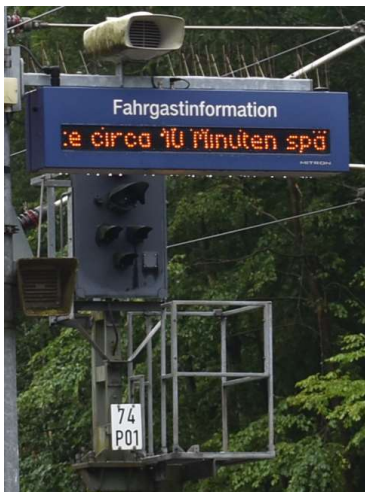
...der RE aus Stralsund hat allerdings +10.