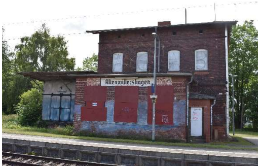
Altenwillershagen , ferngesteuert vom ESTW Velgast