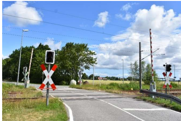
Bahnübergang Altenwillershagen auf der Westseite