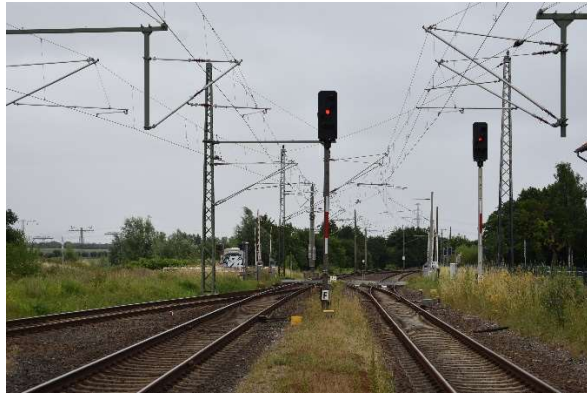
Ausfahrtsignale Bentwisch Ri. Rostock Hbf (Signal F) und G (Ri. Rostock-Seehafen)