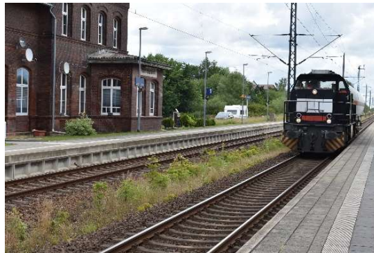
Übergabegüterzug aus Miltzow.