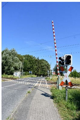
Bahnübergang auf westlicher Bahnhofseite in Martensdorf