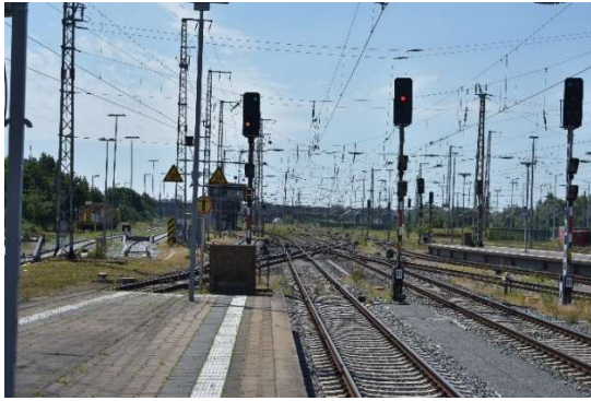
Langsamfahrt nach Altefähr (A) aus Gl. 1