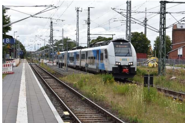
Bahnhof wird derzeit umgebaut, um die höhengleiche Bahnsteigzugänge durch Aufzüge zu ersetzen. Hier Ausfahrt des RE nach Rostock aus Gl. 2.