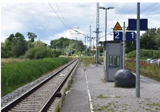
Rövershagen Ri. Bentwisch/Rostock