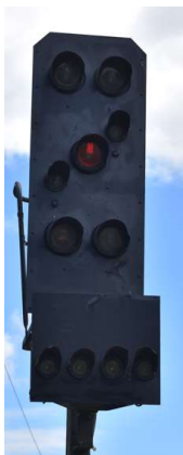
Detail Signal H Bahnhof Rövershagen