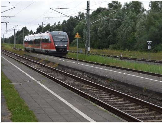
Einfahrt RB aus Graal-Müritz nach Bentwisch