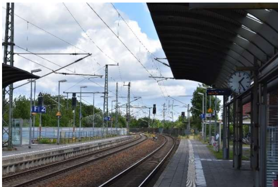
Velgast Ausfahrt Ri. Stralsund