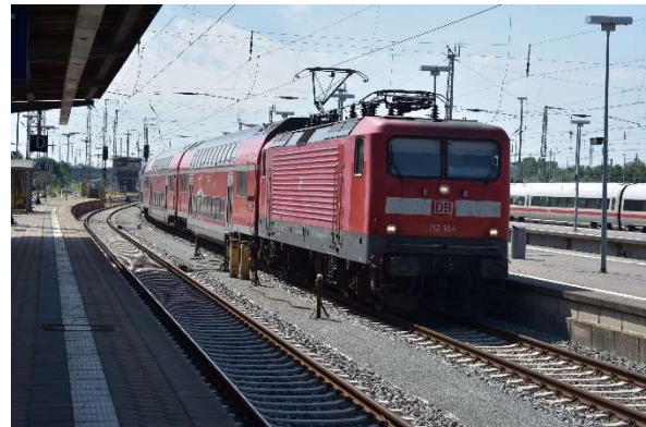
Stralsund Einfahrt Gl. 2 RE aus Berlin