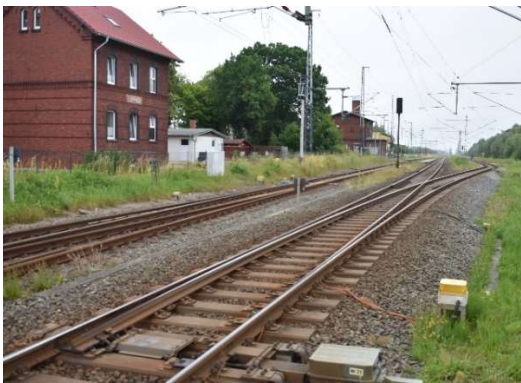
Abzweig Bentwisch zum Düngemittelwerk Poppendorf, im Hintergrund links Bahnhof und Stellwerk