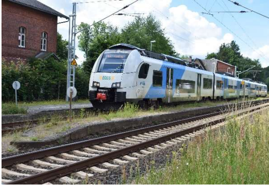
Bahnhof Gelbensande mit RE nach Sassnitz am Hausbahnsteig. Stellwerk örtlich besetzt (Mischung Mechanik und GS II DR)