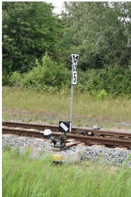
Ortsgestellte Weiche 023 zum Umspannwerk