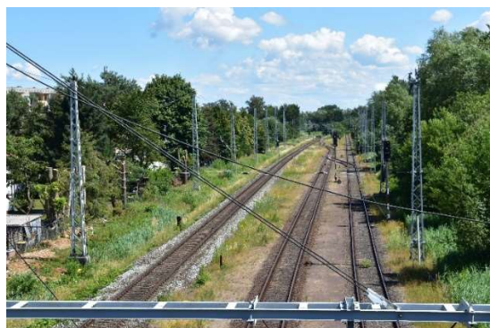
Bahnhofsgleise Ri. Stralsund. Das ganz rechte Gleis ist das Ausziehgleis 11.