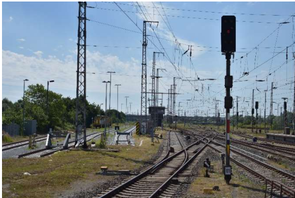
Stralsund Ausfahrtsignal 1 (Gl. 1), im Hintergrund das besetzte GS II DR- Stellwerk B3