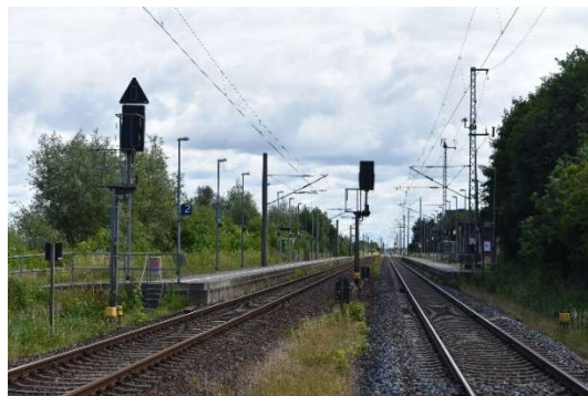
Bahnhofsgleise Altenwillershagen, Ri. Osten