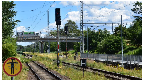
Ausfahrtsignale C (Gl. 1) und D (Gl. 2) Ri. Stralsund