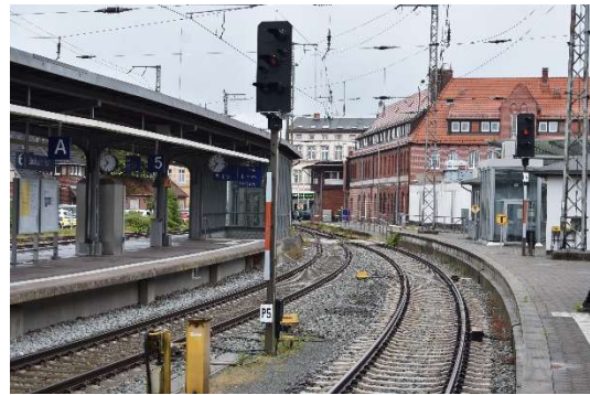
Ausfahrtsignale P4 und P5 Ri. Rostock, im Hintergrund Stellwerk W4