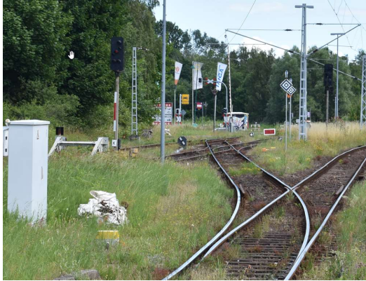
Rövershagen Ri. Graal-Müritz – kurioserweise immer noch mit aufwendiger Doppelkreuzungsweiche