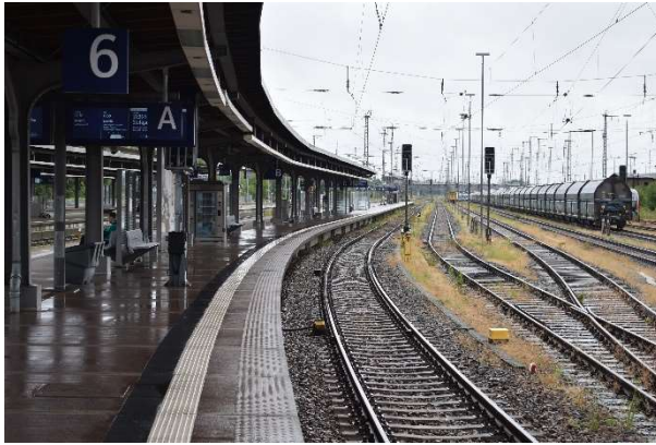
...hier noch einmal mit einem abgestellten Güterzug