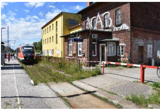
Einfahrt RB aus Ri. Rostock Hbf mit vom Fdl gesicherter Schranke