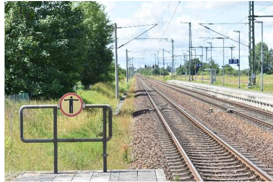
Velgast Ausfahrt Ri. Rostock