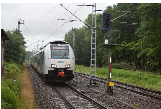
RE fährt nach Buchenhorst ein (der Bahnhof verfügt über nur eine Bahnsteigkante)