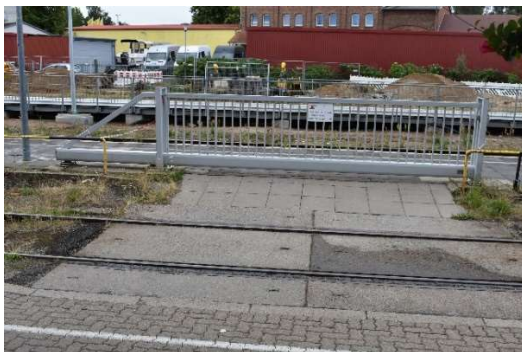
Höhengleicher Bahnsteigzugang zu Gl. 2.