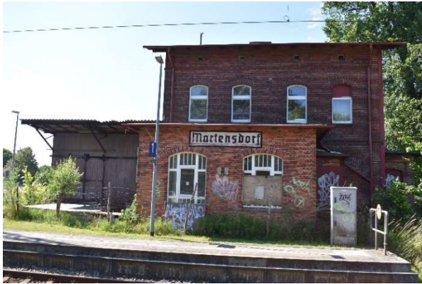
Bahnhof Martensdorf – ferngesteuert von Velgast (ESTW Thales)