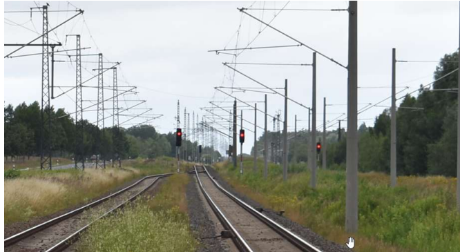
Bentwisch Ausfahrtsignale Ri. Rövershagen/Stralsund. Links Gl. 1 Signal B, Mitte Gl. 2 Signal C. Ganz rechts Ausfahrtsignal Ri. Poppendorf (Signal D). Züge nach Poppendorf werden telefonisch koordiniert.