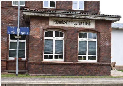
Ehemaliges Stellwerk. Ribnitz-Damgarten Ost wird vom ESTW Velgast ferngesteuert.