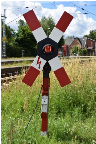
WSSB-Bahnübergang Gelbensande in alter DR-Technik