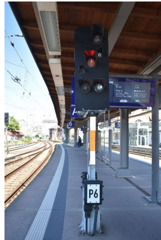
Ausfahrtsignal P6 (Ri. Rostock)