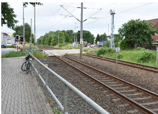
Ribnitz-Damgarten Ost. Bahnübergang Richtenberger Str. (km 39,833) Ri. Rostock