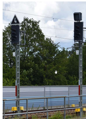
Ausfahr- bzw. Zwischensignale Velgast Ri. Stralsund