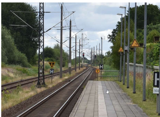
Ausfahrtsignale P3 und P1 Ri. Stralsund