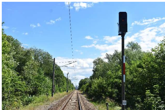
Nicht zuletzt das Einfahrtsignal zum Bahnhof Poppendorf. Dieser ist örtlich mit einem Fdl besetzt. Im Hintergrund kann schwach die Düngemittelfabrik erahnt werden.