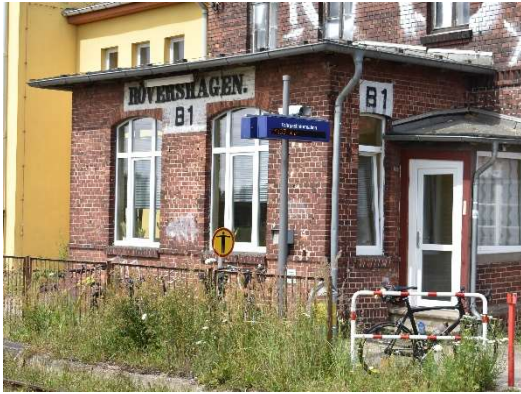
Bahnhof Rövershagen mit örtlich besetztem GS II DR-Stellwerk